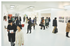
1F<メインギャラリー> 全国のキュレーターや美術関係者が推薦する気鋭の作家の作品が並び、展覧会形式のアートフェア会場