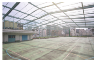
<屋上> 開放感ある「場」の力と作品がぶつかりあう屋外展示の会場