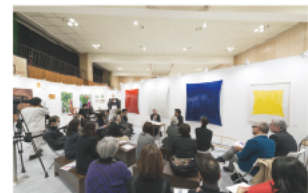
2F<体育館内 イベント会場> アートの専門家、観者によるトークイベントを開催