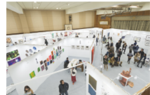
2F<体育館> 国内・アジアのギャラリーや大学・美術団体が集結したブース形式のアートフェア会場