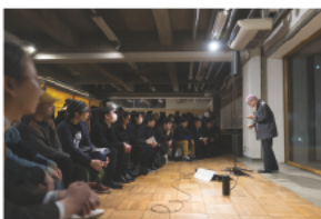
1F<コミュニティスペース> アーティストによるパフォーマンス、トークイベント