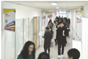
地下～3F<教室エリア> 3331に入居するギャラリー・団体も参加。渾身の展示に加えアートプロジェクトのアーカイブ展示も

アーティスト主導で「場」の創造に取り組んできた 3331 が提示する「もうひとつのアートフェア」。それは、アートシーンのこれからの予見する、オルタナティブなアートフェアです。