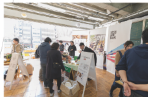
1F<コミュニティスペース> 3331近隣店舗によるフードマーケットやブックマーケットも開催