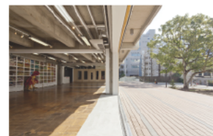
地下～3F<パブリックエリア> ウッドデッキ、廊下、屋外など共有部分への作品展示